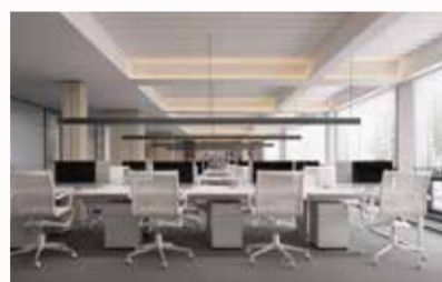
综合楼及办公区效果图

宅起祥云托北斗,楼升瑞气映朝阳。9月11日,伴随着最后一方混凝土的浇筑到位,在众人的期盼中,东田厂区综合楼主体结构施工全部完成,喜迎封顶,美好盛启!