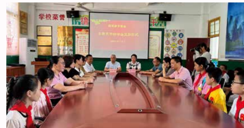
山西小学奖教奖学发放仪式

四时俱可喜，最好清秋时。在秋高气爽，尽享丰收喜悦的时节，9月15日，固美主动举办，每年两次的奖教奖学助学活动，在莆田市东田镇美洋小学和山西小学如期举行。东田镇党委书记黄秋燕、固美集团董事长陈东升出席活动。