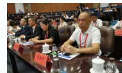
○第三届城市绿色发展大会

9月8日上午,在中国国际投资促进会会长马秀红、工业和信息化部原党组成员郭炎炎、国家发展改革委环资司二级巡视员杨尚宝、中国国际投