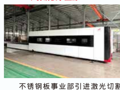
不锈钢板事业部引进激光切割

机，已完成测试。新设备的投产，大幅度提高生产加工能力，进一步提升了固美不锈钢的生产范围、能力和效率。