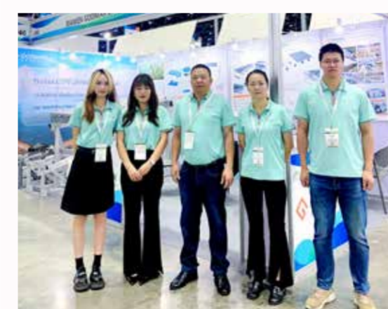
○泰国国际可再生能源展

8月30日至9月1日,泰国国际可再生能源展(ASEW)于曼谷隆重举办。ASEW是东南亚地区最全面、规模最大的行业标杆展会,受到当地能源部、工业部的大力支持与众多业内人士的高度认可。