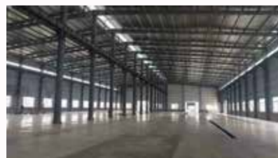
溪美总部厂房升级3期工程竣工

今年以来,固美各大基建项目如火如荼的推进,金固美厦门新办公室的启用,溪美总部厂区3幢车间的竣工,东田综合楼的封顶,无不彰显固美时不我待的朝气蓬勃和新新向荣。