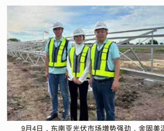
○18MW铝合金地面项目投建

9月4日,东南亚光伏市场增势强劲,金固美深度把握需求,18MW铝合金地面项目的投建,正是金固美不断开拓市场的有力见证。