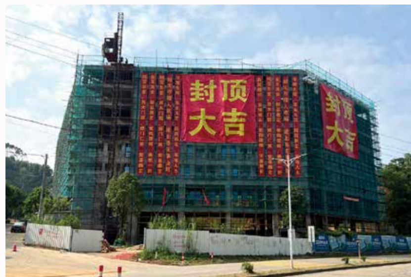
○东田厂区综合楼封顶