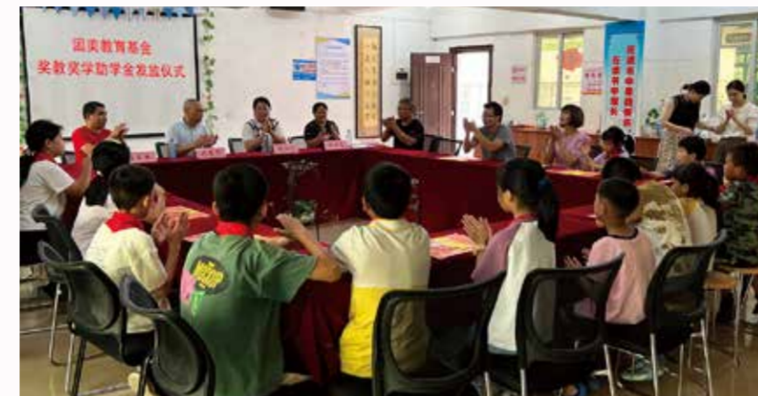
美洋小学奖教奖学发放仪式